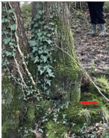
Pied de la cépée de l'arbre