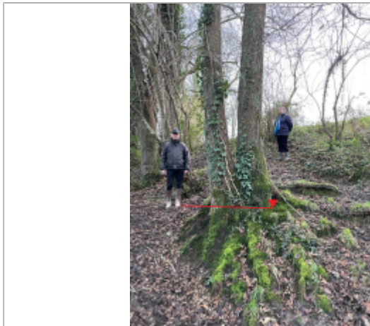
Parcelle en fond de talweg à proximité de l'axe du fossé

Coordonnées WGS84 : X: 0.17576228 / Y: 49.12409070