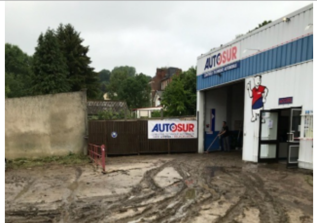
Repère de crue mesuré sur les bâtiments du garage Autosur