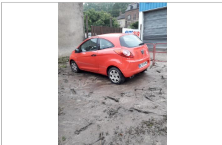
repère de crue sur local et bureau du controle technique Autosur