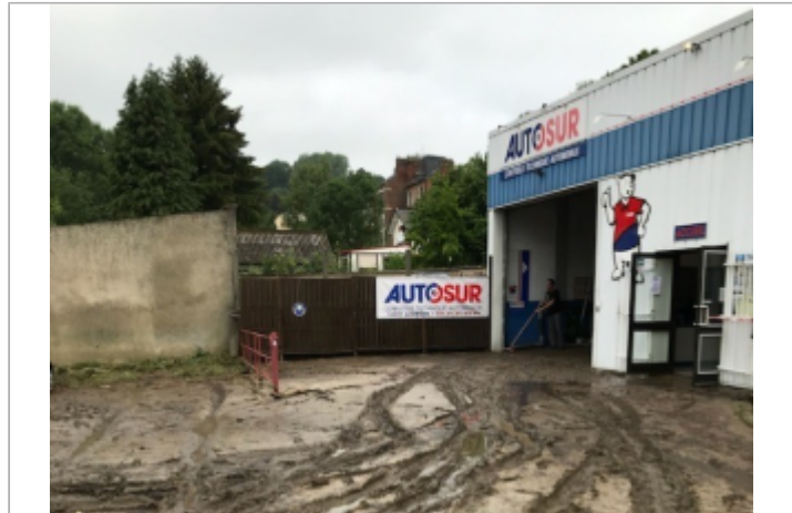
Repère de crue mesuré sur les batiments du garage Autosur