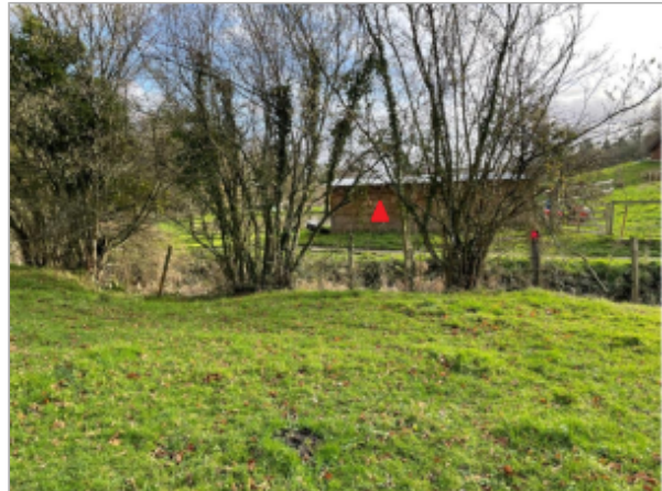
Remise en bois sur la partie nord de l'étangs de pêche