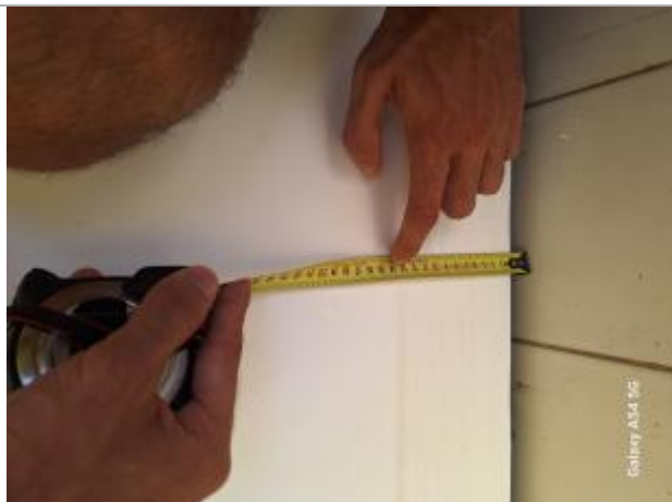
Dépôts de matières solides

Altitude calculée de l'eau (en m) : 17.042