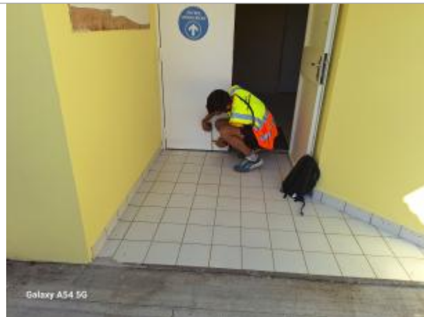
Entrée salle des profs