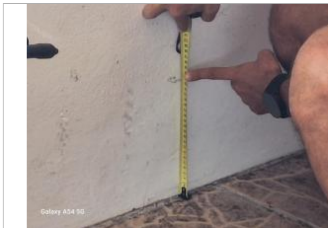
Témoignage hauteur d'eau