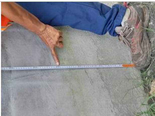
Témoignage hauteur d'eau

Altitude calculée de l'eau (en m) : 2.015