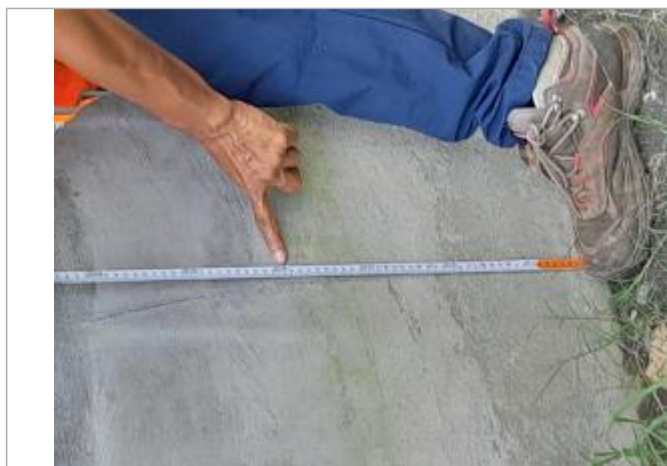
Témoignage hauteur d'eau

Altitude calculée de l'eau (en m) : 2.015