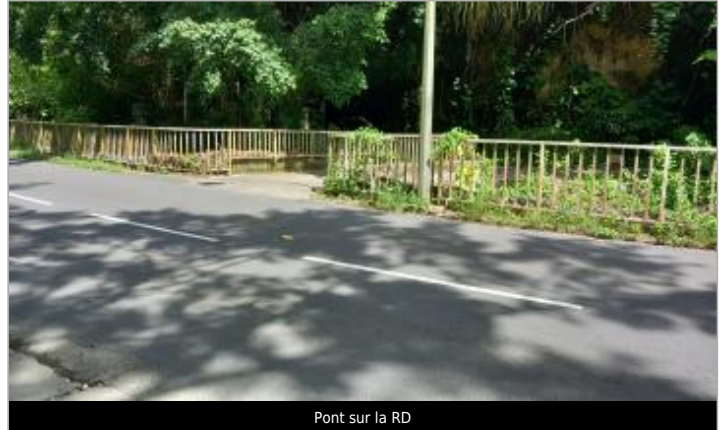
Pont sur la RD