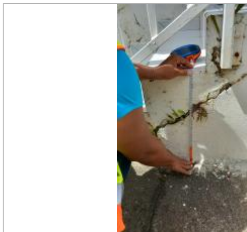
Témoignage d'une hauteur d'eau