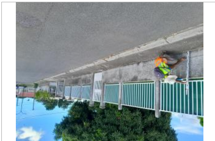
Mur de clôture