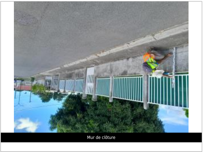
Mur de clôture