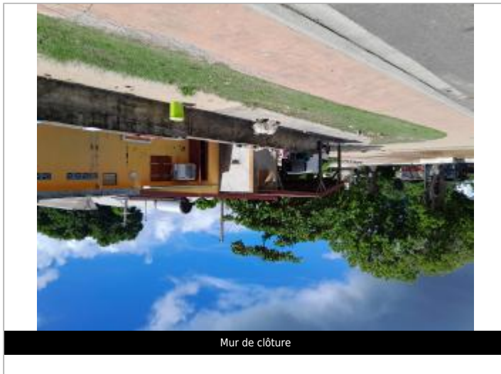
Mur de clôture