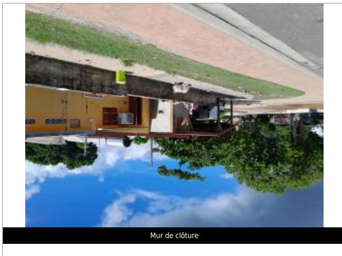
Mur de clôture