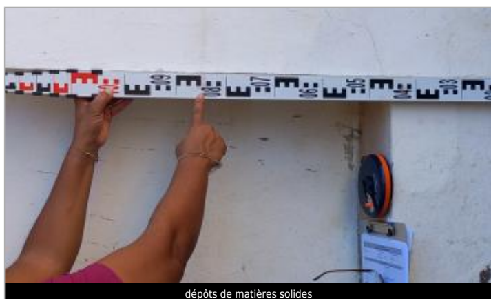
dépôts de matières solides