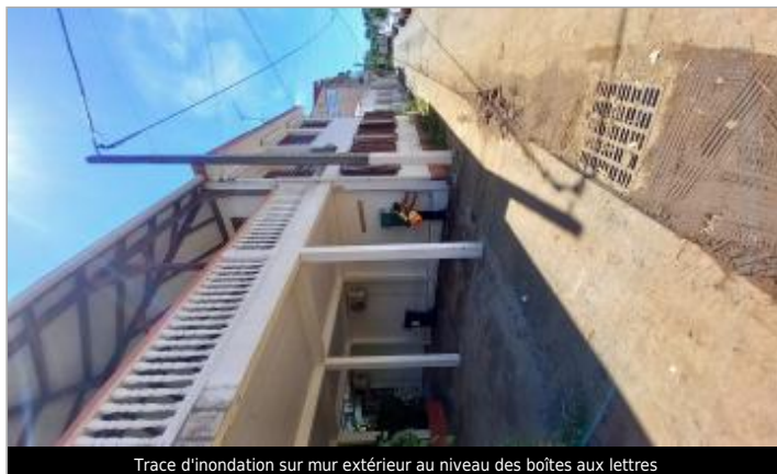
Trace d'inondation sur mur extérieur au niveau des boîtes aux lettres