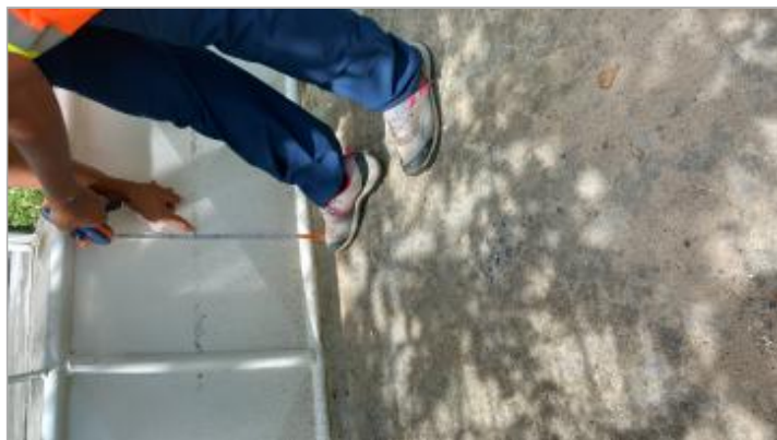
Dépôts de matières solides