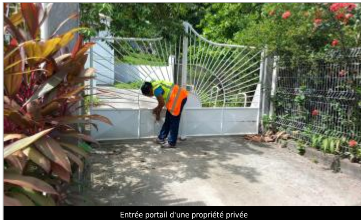
Entrée portail d'une propriété privée

Coordonnées WGS84 : X: -61.47817380 / Y: 16.22218550