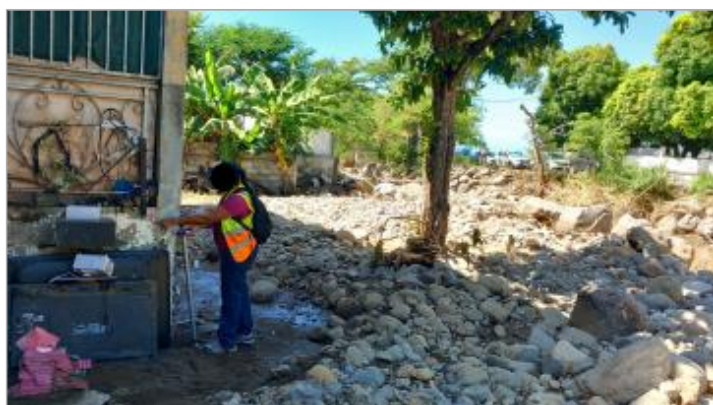
Témoignage de la hauteur d'eau atteinte

SOURCE DE REPÉRAGE : COLLECTE POST-INONDATION, DEAL GUADELOUPE (TAMMY 22/10/23) - 24/10/2023