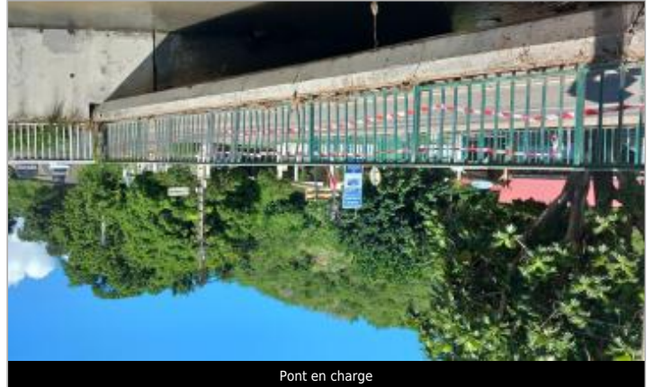
Pont en charge