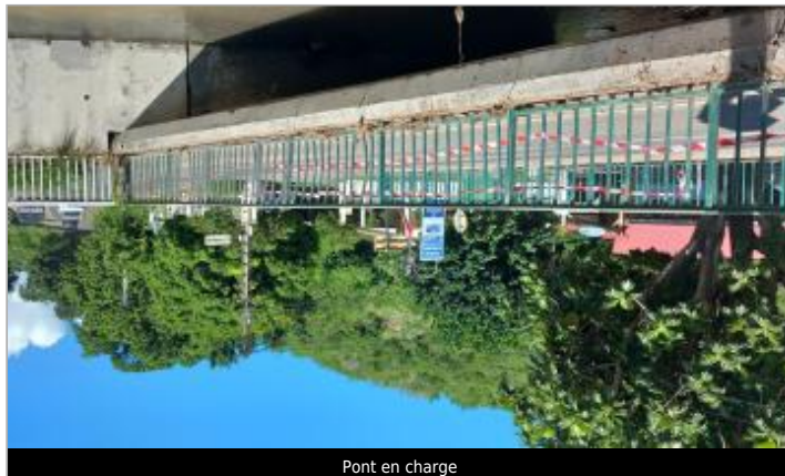
Pont en charge