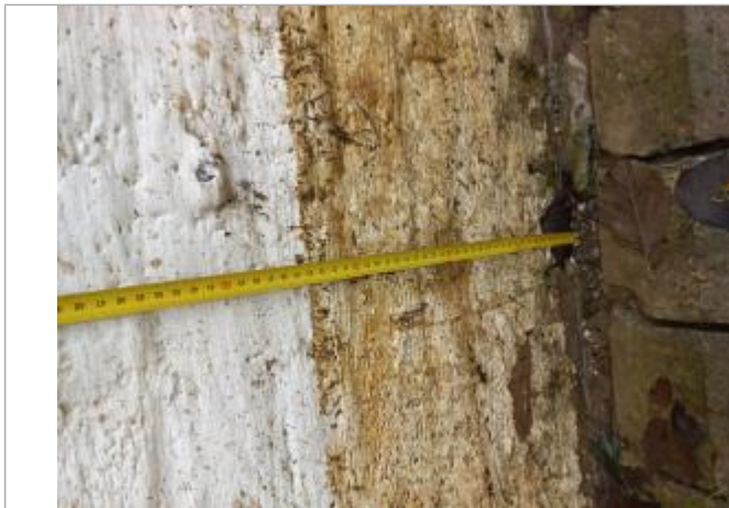
Laisse à 24cm du sol