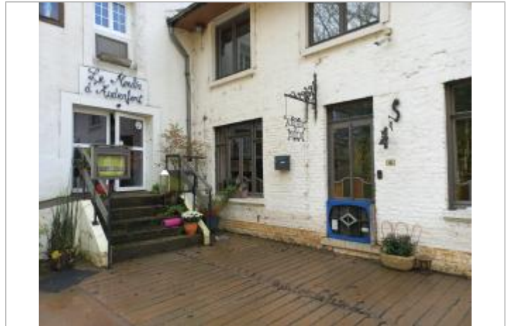
Laisse de crue