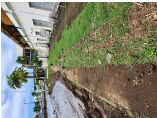
dépôts de matières solides représentant l'emprise maximale de la zone inondée

Altitude calculée de l'eau (en m) : 3.585 m