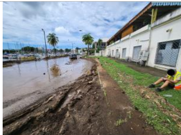
Emprise de zone inondée le long de la RD6