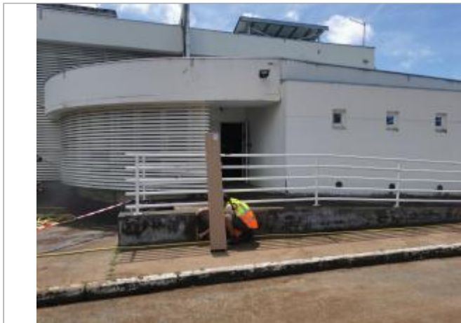
Entrée du personnel