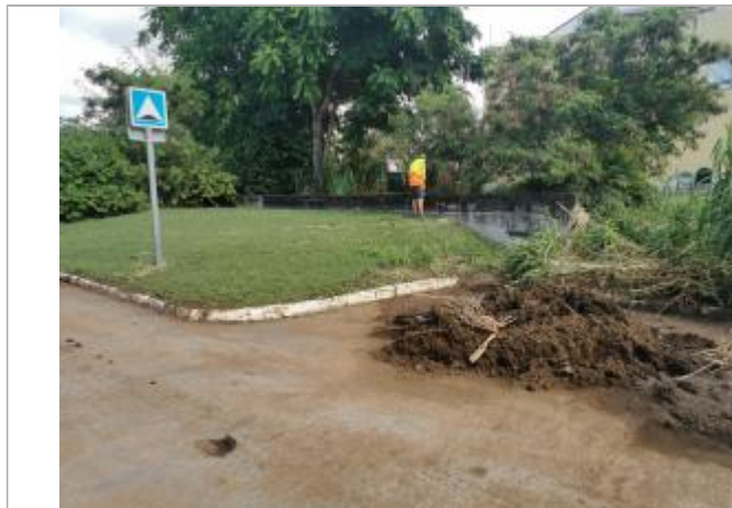
Emprise de zone inondée