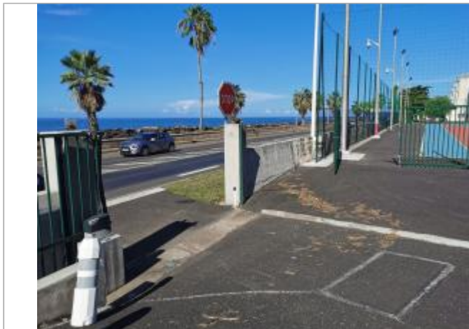
Vue de l'emprise inondée

Coordonnées WGS84 : X: -61.72556010 / Y: 15.98824660