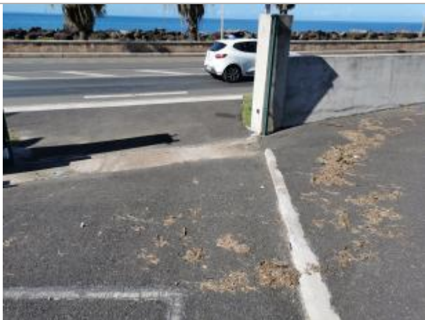
Emprise de zone inondée