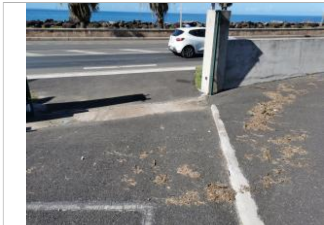
Emprise de zone inondée

Altitude calculée de l'eau (en m) : 3.496