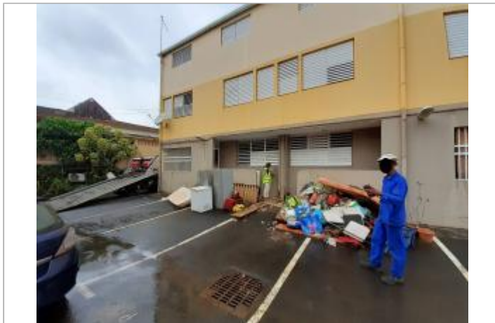
Façade extérieure du bâtiment