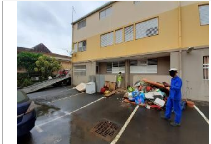
Façade extérieure du bâtiment

Coordonnées RGF93 (ETRS89) : X: -61.645189 / Y: 15.9757069