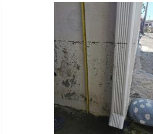
Dépôts de matières solides