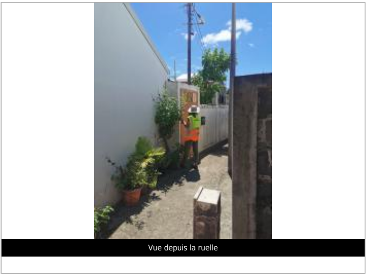
Vue depuis la ruelle