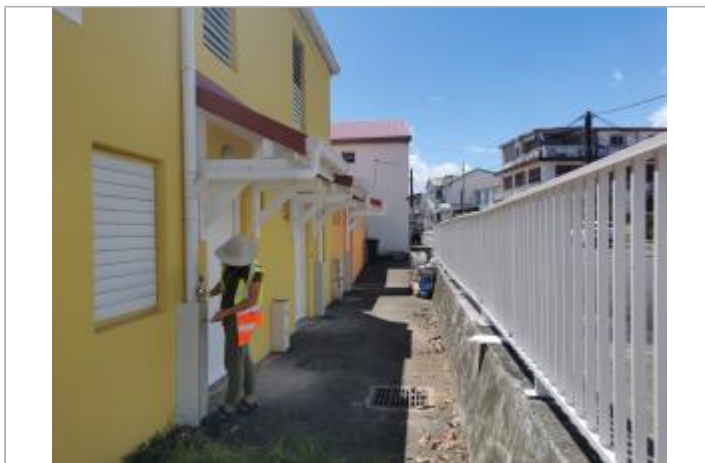
Vue entrée appartement