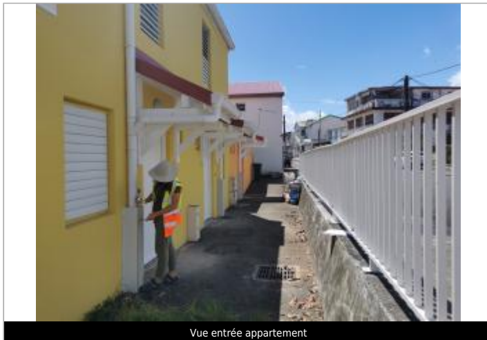
Vue entrée appartement