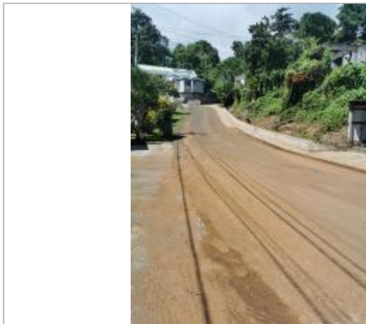
Accès vers le pont