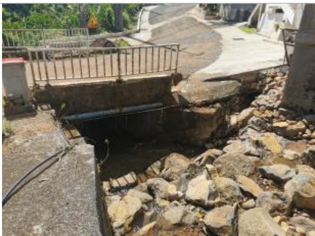
Pont en charge et fortement obstrué