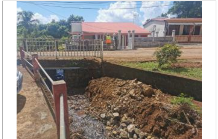
Pont en charge