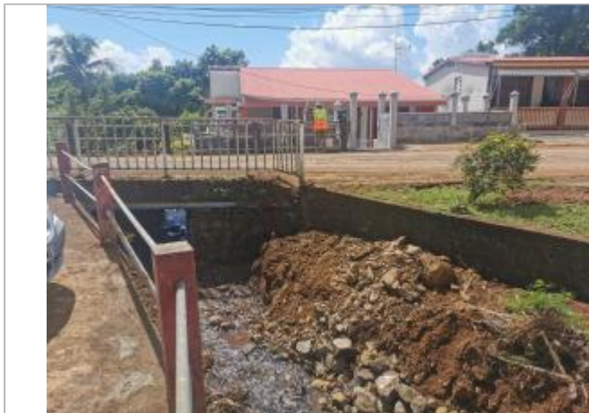
Pont en charge

Coordonnées WGS84 : X: -61.60182800 / Y: 16.00569880