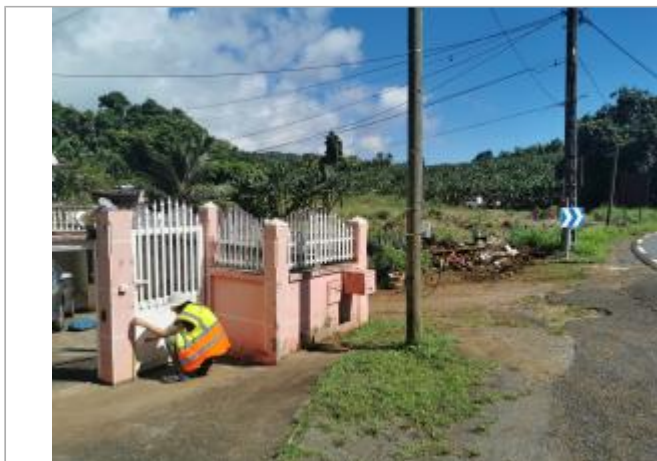
Mur de clôture d'une maison individuelle