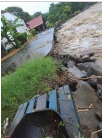
Erosion de la berge