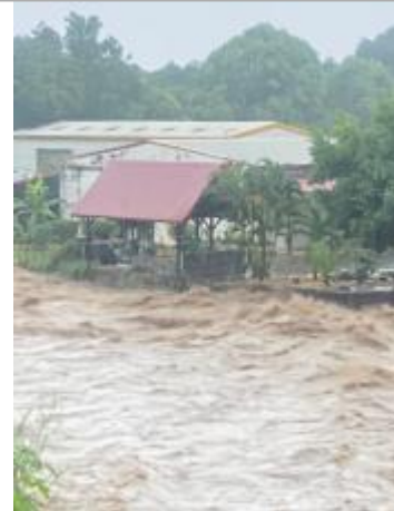
Pendant l'inondation (présence du carbet)