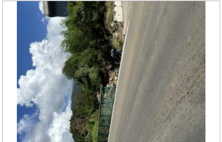
Destruction barrière de sécurité à l'amont du pont