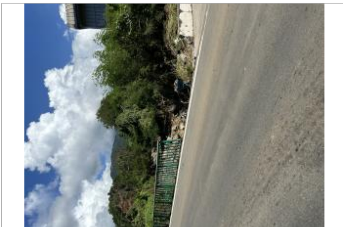
Destruction barrière de sécurité à l'amont du pont