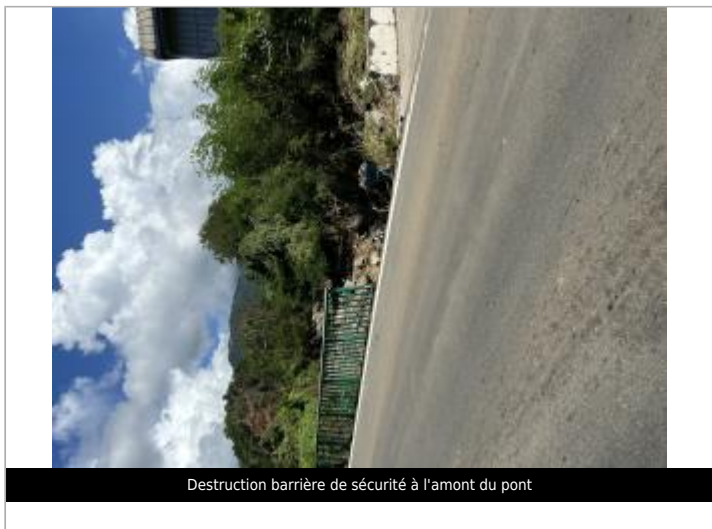
Destruction barrière de sécurité à l'amont du pont