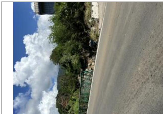
Destruction barri re de s curit    l'amont du pont