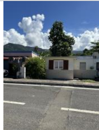
Mur extérieur maison le long de la RN2

Coordonnées RGF93 (ETRS89) : X: -61.7673721 / Y: 16.0820048