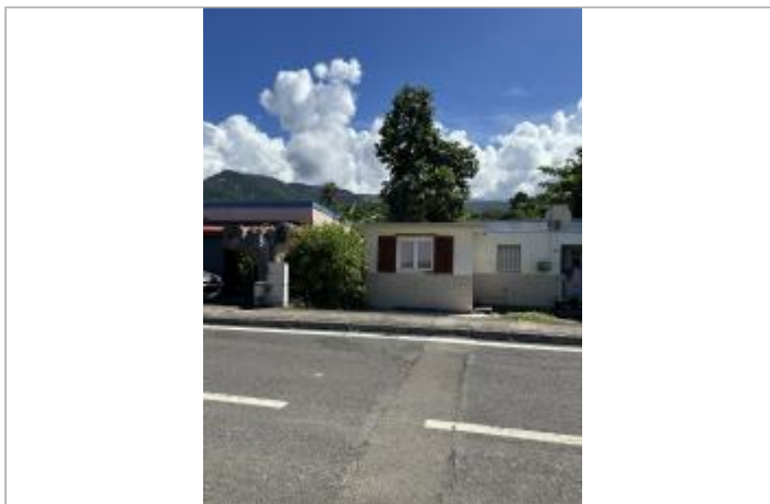
Mur extérieur maison le long de la RN2