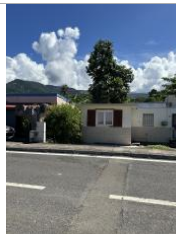
Mur extérieur maison le long de la RN2

Coordonnées RGF93 (ETRS89) : X: -61.7673721 / Y: 16.0820048