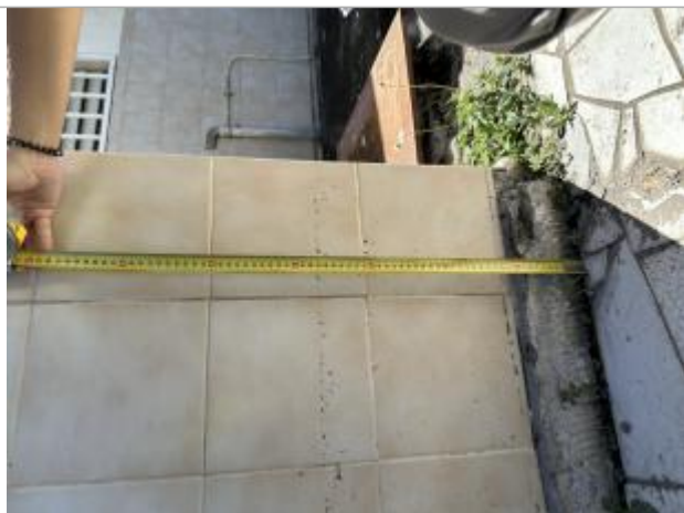
Dépôts de matières solides

Altitude calculée de l'eau (en m) : 2.62