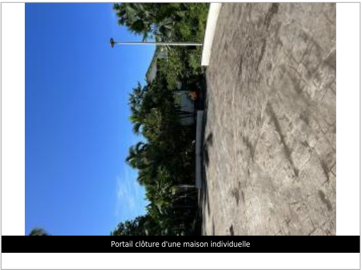
Portail clôture d'une maison individuelle