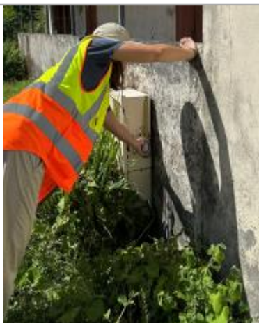
Dépôts de matières solides

Altitude calculée de l'eau (en m) : 2.56 m