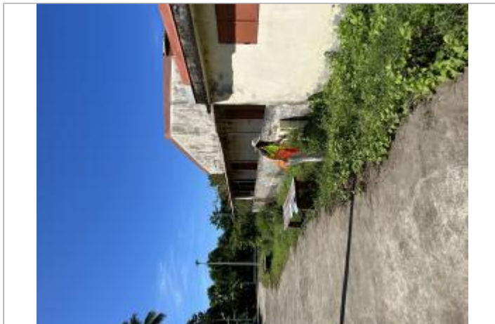
Coffret électrique d'un bâti privé