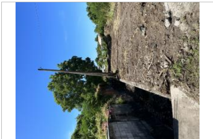
Vue de l'aval de l'ouvrage de franchissement