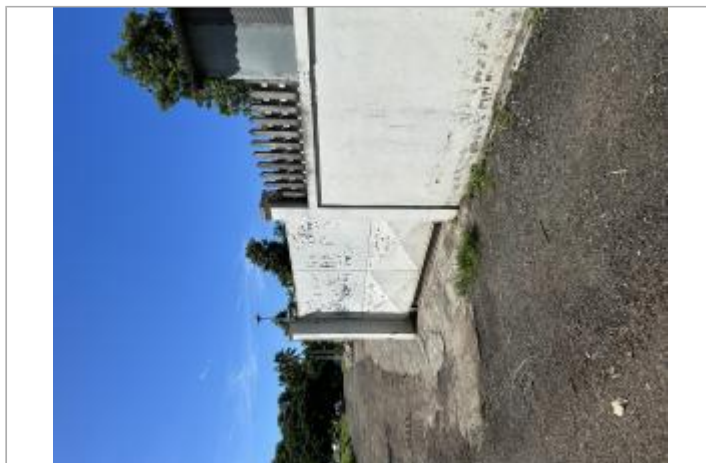
Mur de clôture d'une maison individuelle