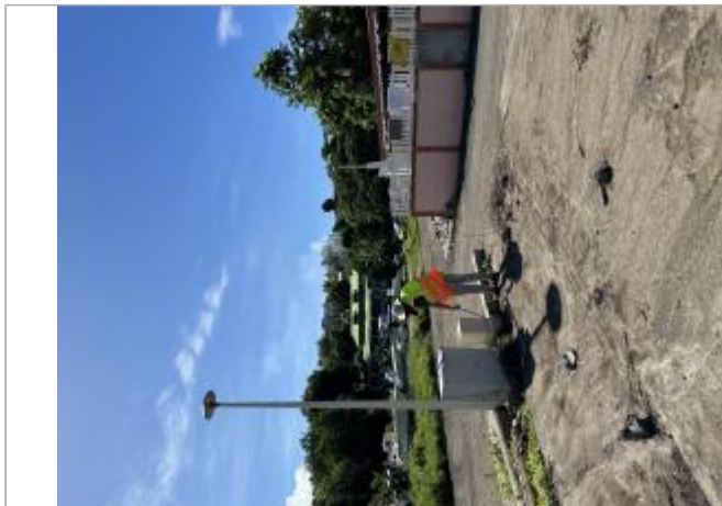
Coffret électrique d'une ancienne propriété