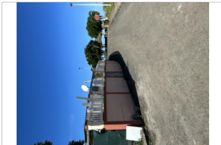
Mur de clôture d'une maison individuelle