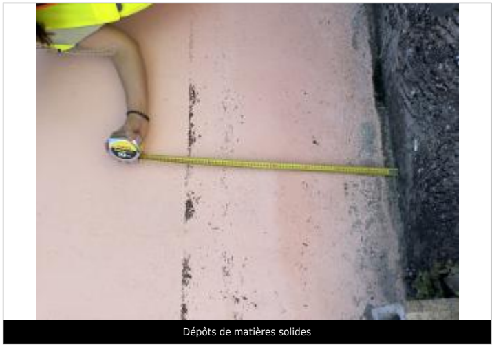
Dépôts de matières solides