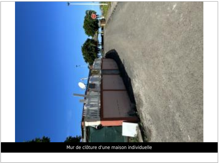
Mur de clôture d'une maison individuelle