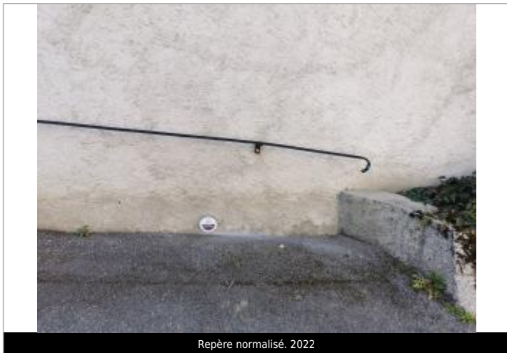
Repère normalisé. 2022