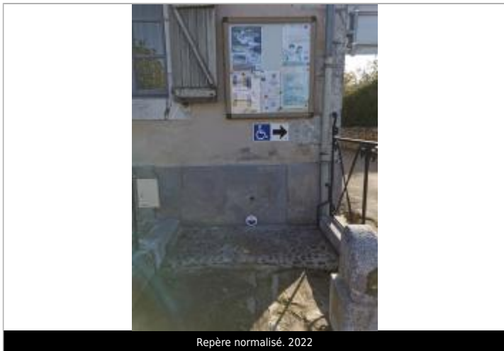
Repère normalisé. 2022

GÉNÉRAL Code : WEB_R_202310261433 Date de mise à jour : 11/07/2024 Auteur : PAPINESTE2