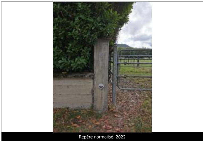
Repère normalisé. 2022

NIVELLEMENT LORS DE LA POSE PAR OGOXE EN 2022 Altitude de la référence (en m) : 430.700 m Altitude calculée de l'eau (en m) : 430.7 m