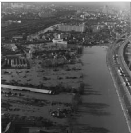
Photographie aérienne de l'inondation de novembre 1974