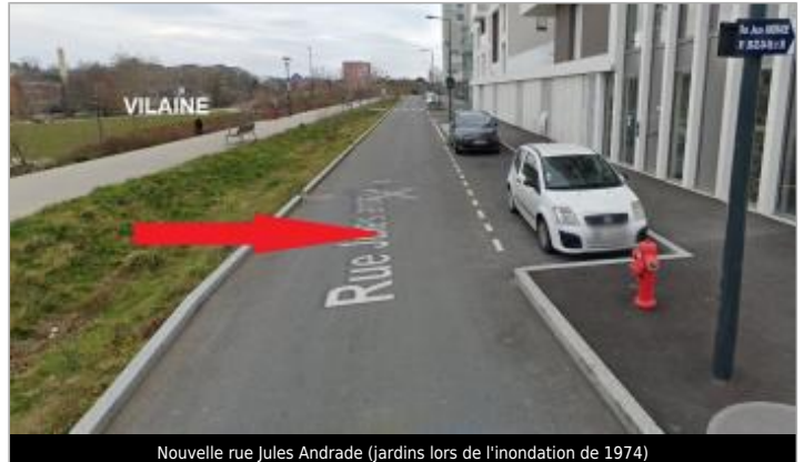
Nouvelle rue Jules Andrade (jardins lors de l'inondation de 1974)

Coordonnées WGS84 : X: -1.64894932 / Y: 48.10941260