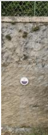
Repère normalisé. 2022