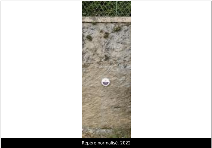
Repère normalisé. 2022