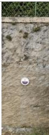
Repère normalisé. 2022