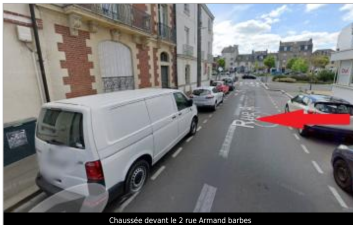
Chaussée devant le 2 rue Armand barbes