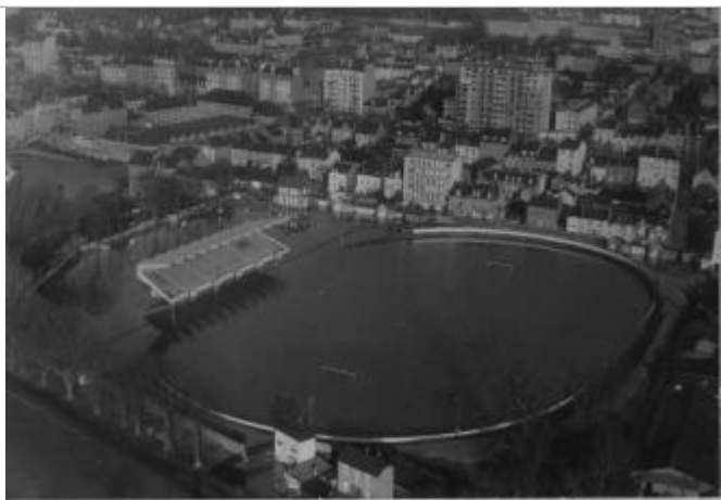
Photographie aérienne de l'inondation de novembre 1974

Altitude calculée de l'eau (en m) : 26.25