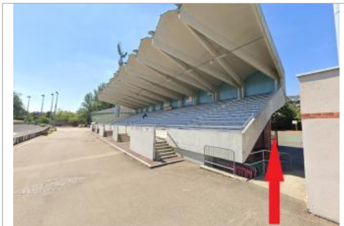
A l'arrière des tribunes du vélodrome